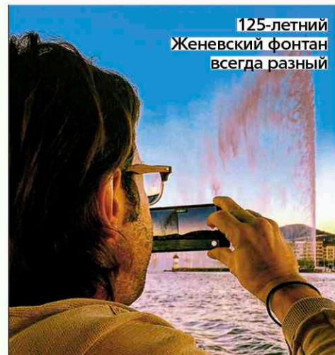
125-летний Женевский фонтан всегда разный