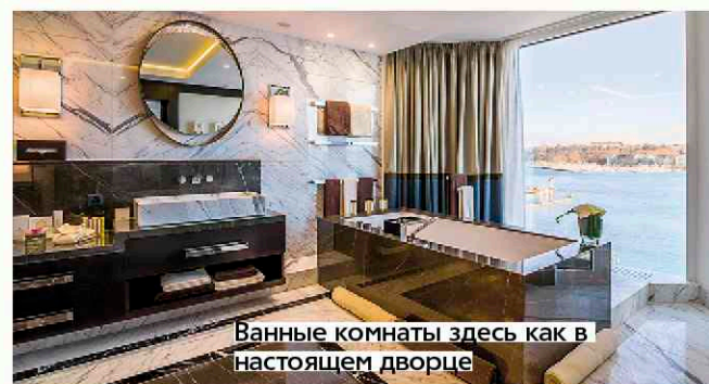
Ванные комнаты здесь как в настоящем дворце