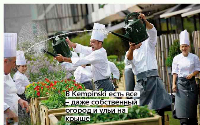
В Kempinski есть все – даже собственный огород и ульи на крыше