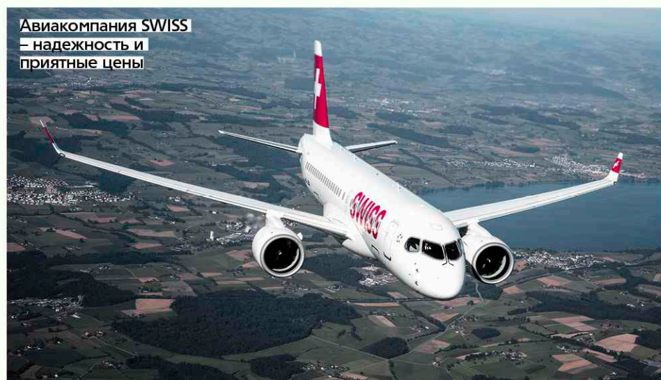
Авиакомпания SWISS – надежность и приятные цены