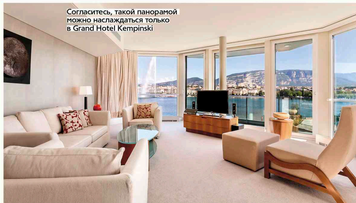
Согласитесь, такой панорамой можно наслаждаться только в Grand Hotel Kempinski