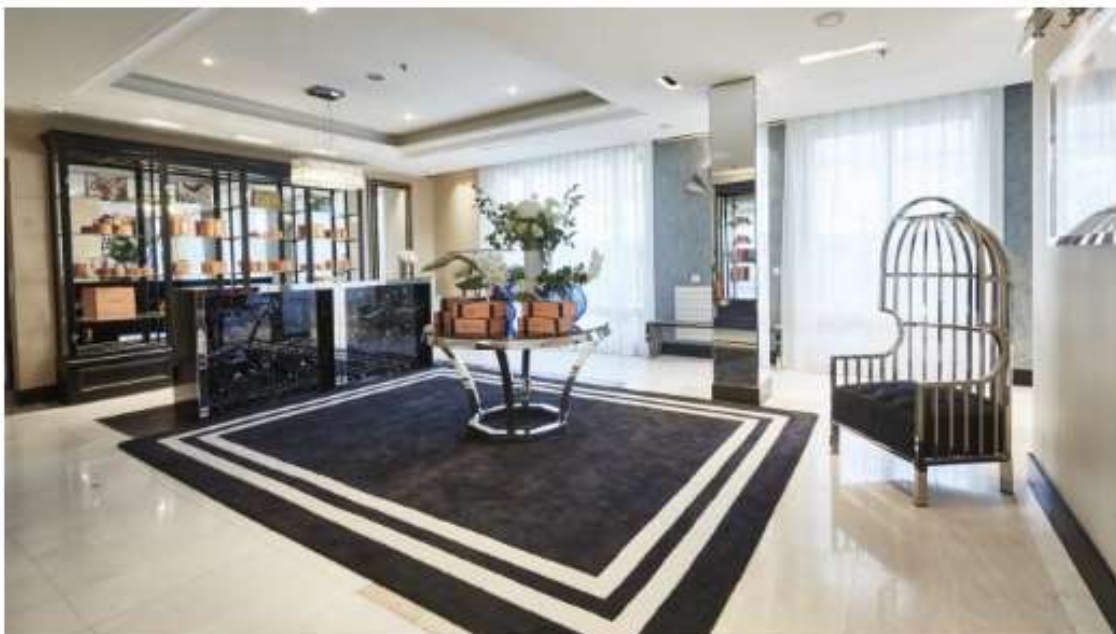
Nouveau Design Beauty Spa L.RAPHAEL Cannes Hotel Martinez

Comme chaque année, lors du festival, L.RAPHAEL présente en avant-première ses nouveautés. Cette année, la marque présente son Spa de 900 m 2 , entièrement revisité et composé de 10 cabines de soins, d'un salon de coiffure et d'une croisière beauté.