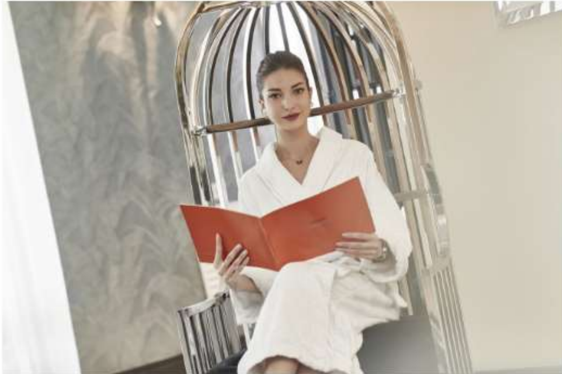
Beauty Spa L.RAPHAEL Cannes Hotel Martinez – Photo Jean François Romero

Réputée comme étant l'une des plus prestigieuses marques de beauté Suisses et l'une des plus pointues grâce à ses soins avant-gardistes, le Spa L.RAPHAEL prépare les stars, les femmes et les hommes à monter les marches du Palais et à s'offrir une parenthèse loin du tumulte du quotidien.