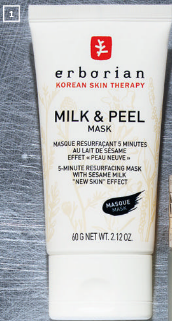
1. МАСКА, ERBORIAN, 2790 руб.

Разглаживающая маска-пилинг с кунжутным молоком улучшит цвет лица и поможет справиться с морщинами.