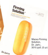
Маска Firming Solution, Dr. Jart+, 3015 руб. (5 шт.)