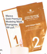
Маска Gold Premium Modeling Mask, Shangpre, 399 руб.