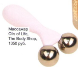
Массажер Oils of Life, The Body Shop, 1350 руб.