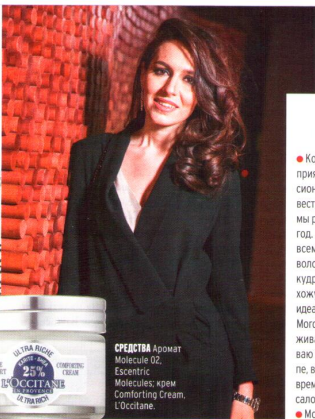
СРЕДСТВА Аромат Molecule 02, Escentric Molecules; крем Comforting Cream, L'Occitane.