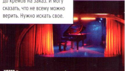
МЕСТО Париж — один из моих любимых городов. Недавно побывали с мужем в клубе Дэвида Линча — Silentso.