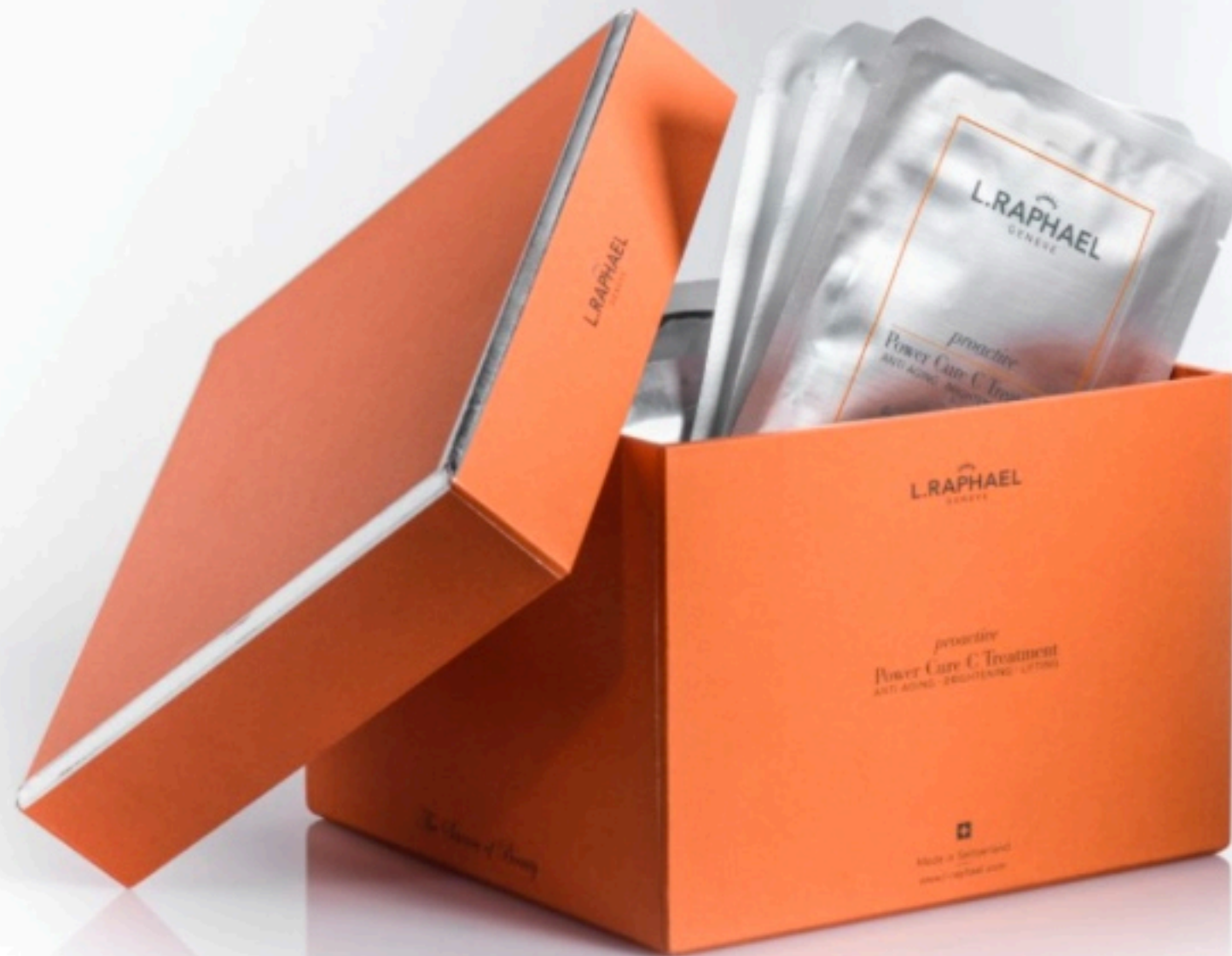
L. Raphael Power Cure C Treatment